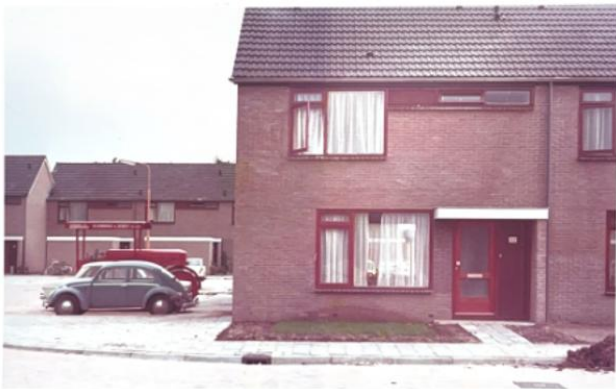
Jacob van Campenkwartier in 1972 en 2026